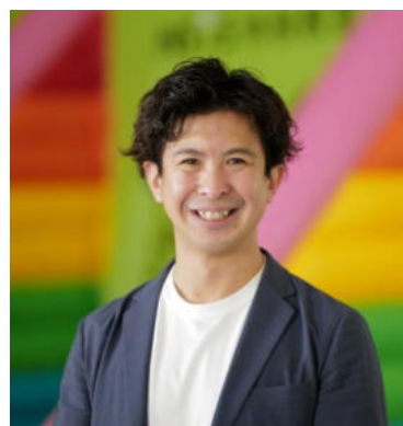
ネイス株式会社 代表取締役