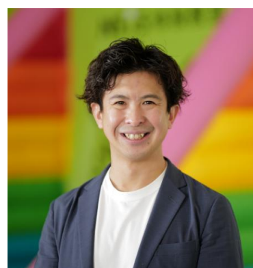
ネイス株式会社 代表取締役